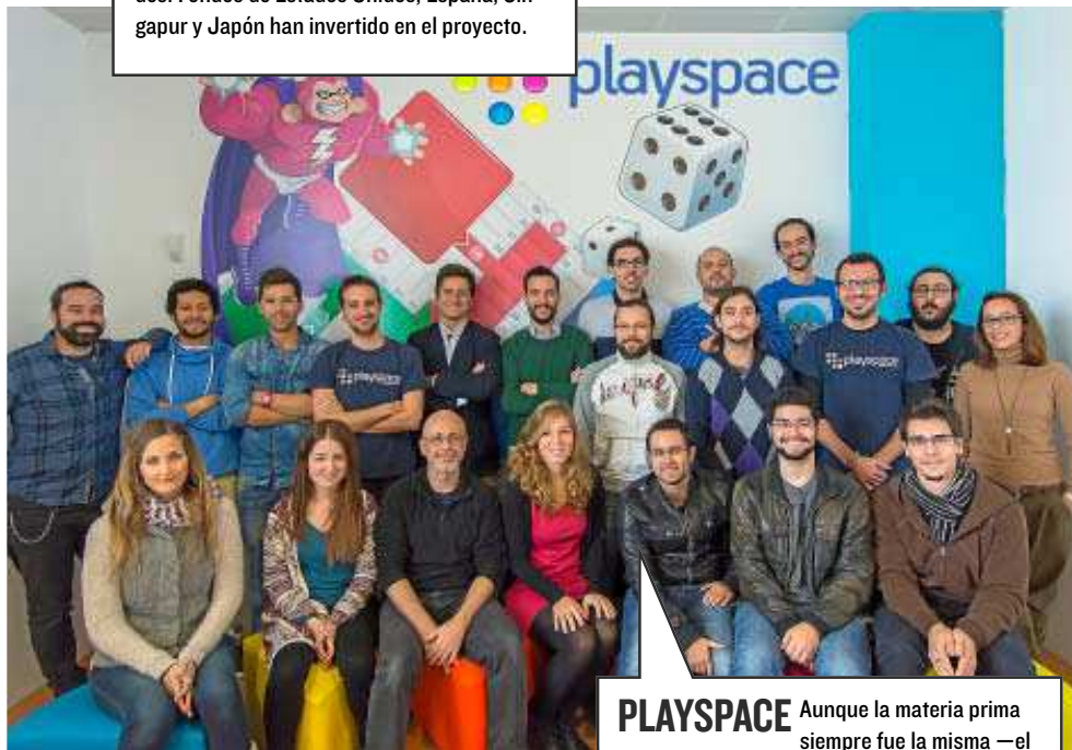
PLAYSPACE Aunque la materia prima siempre fue la misma —el videojuego—, al principio solo se trabajaba el formato flash y después se avanzó hacia la multiplataforma. El primer juego para el nuevo reloj de Apple lo firmará Playspace, que aún se alimenta principalmente de Facebook, aunque Android e iOS ganen terreno.