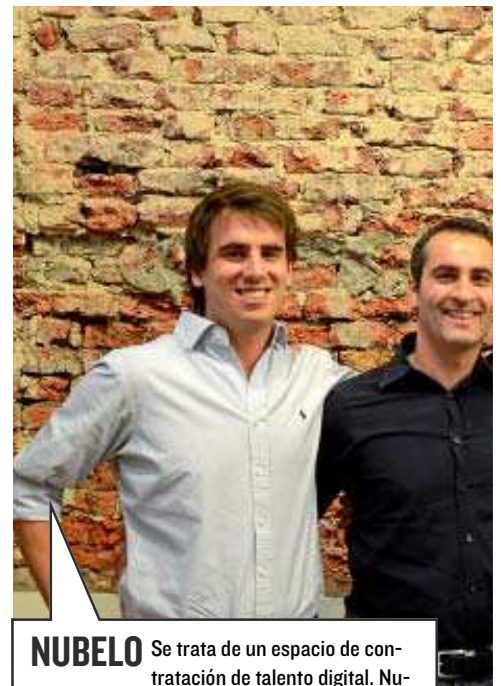
NUBELO Se trata de un espacio de contratación de talento digital. Nubelo opera en los países de habla hispana y también en Brasil (a través de la web prolaner.com.br ). La gente publica libremente sus proyectos y necesidades de colaborar. Se puede trabajar por horas y por proyectos y todo está basado en la reputación.

para afinar la búsqueda y habilita un chat para que los usuarios contacten entre ellos. Con operaciones en Estados Unidos, Inglaterra, Portugal, Francia y México, "es como salir de compras sin moverte de casa".