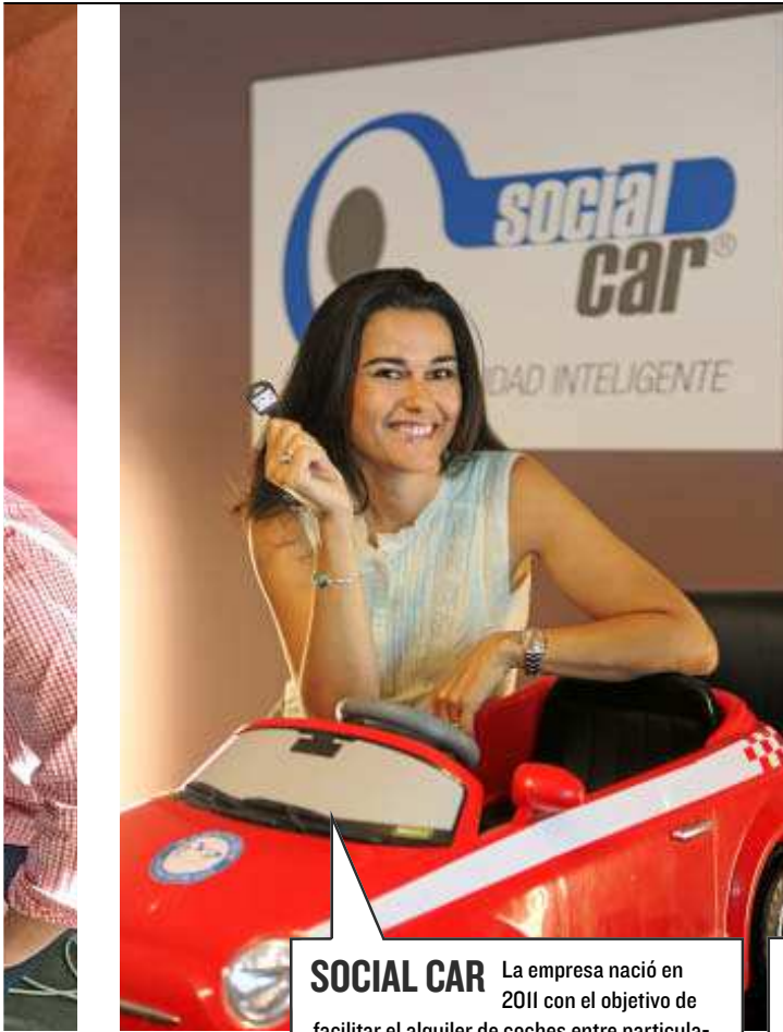
SOCIAL CAR La empresa nació en 2011 con el objetivo de facilitar el alquiler de coches entre particulares. Es una plataforma online donde registras tu vehículo, publicas tu perfil y otras personas acuden a ti en busca de utilitarios, furgonetas y hasta vehículos de alta gama por horas, días, semanas o meses.