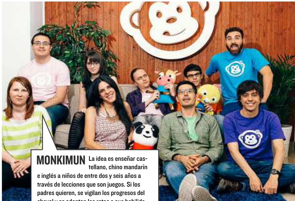
MONKIMUN La idea es enseñar castellano, chino mandarín e inglés a niños de entre dos y seis años a través de lecciones que son juegos. Si los padres quieren, se vigilan los progresos del chaval y se adaptan los retos a sus habilidades. Fondos de Estados Unidos, España, Singapur y Japón han invertido en el proyecto.