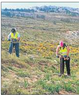
Reforestación de bosques SYLVESTRIS

miento de bosques, con una solución innovadora de siembra y trabajando por la inserción social y laboral de personas con discapacidad. Esta operación es el primer caso de éxito de la fundación a través de su plataforma de inversión, que tiene abiertas otras cuatro empresas. / Redacción